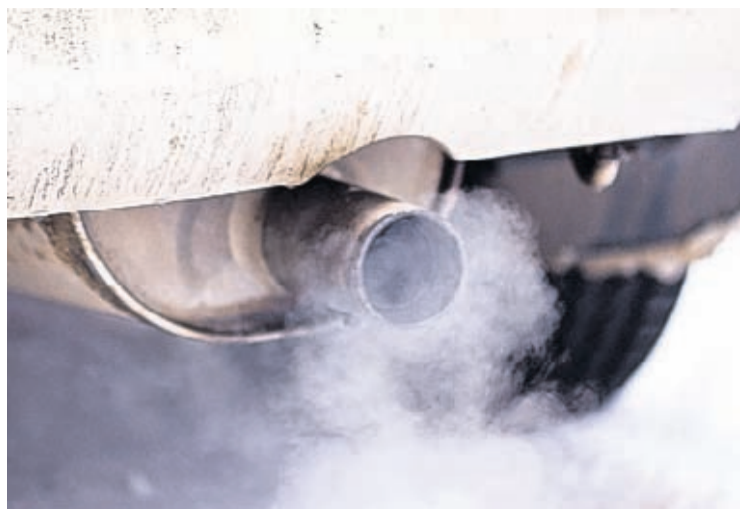
(dutchnews.nl) – Contaminacion mas pisa den aire den provincianan sur di Noord-Brabant y Limburg

burg na Hulanda ta parce di empeora e impacto di coronavirus, segun un estudio di cientificonan Britanico.